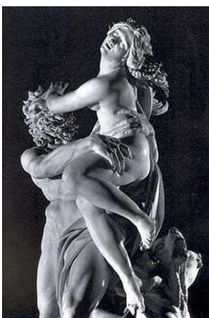
Escultura que representa

El mite explica que durant l'època de primavera i estiu, com la Persèfone estava amb la seva mare( deesa de la collita i els cereals) que estava contenta i llavors, feia bon temps i hi havia molta collita, mentre que durant la resta de l'any, tardor i hivern, com estava amb Hades, i la mare estava trista, feia un temps més dolent i la collita era molt pitjor. D'aquesta manera és com els grecs explicaven les estacions de l'any, ja que no savien com raonar científicament la explicació correcta del clima.