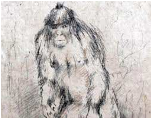
Dibuix que representa la constitució d'un Yeti

L'Abominable home de les neus o Yeti, és un ser que" suposadament" viu a la serralada de l'Himalaya. La seva existència no passa de ser un mite, encara que hi ha hagut molta gent que diu que s'ha trobat un Yeti caminant per la neu de l'Himalaya. D'existir, es podria considerar un tipus de primat semblant a l'orangutà, encara que de proves que demostrin amb certesa que existeix un animal com aquest no n' hi ha. Els no creients afirmen que són o óssos o un animal semblant.