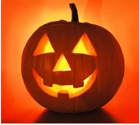
Imatge de una Carbassa típica el día de Halloween