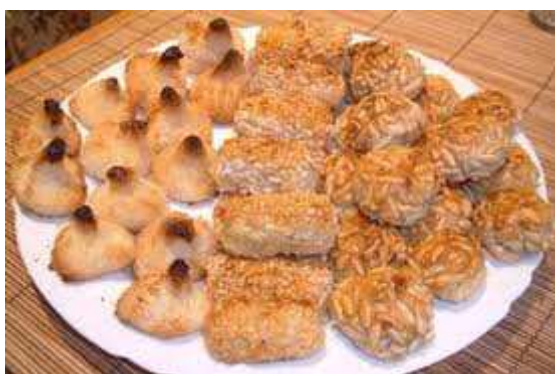
Imatge de diferent tipus de panellets

Els Panellets: Són un costum dolç típic d'aquesta celebració, que antigament no es compraven molts, sinó que la gent es guanyava en rifes que es feia durant quasi tot el dia o se'ls feia a casa. Amb l'arribada de les pastisseries, es van anar comprant més i les rifes van acabar desapareixent. Normalment es menjaven després de sopar. També una altra tradició amb els panellets era que els avis compraven panellets per als néts, ja que tenen un gust més dolç i els nens prefereixen.